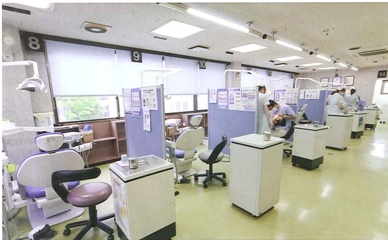
複数の診察台が設けられた診察室

むし歯治療においても、患者が満足する医療を目指して、丁寧に説明を行った上で治療に取り組み、詰め物や被せ物の作製に補綴の知識を持つ歯科医師がかかわることで、見た目やかみ心地のよさを追求している。さらに、神経まで痛んだ歯には根尖病巣を抑制するために根管治療を行い、マイクロスコープ