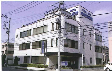
浅賀歯科医院外観。JR武蔵野線南越谷駅徒歩3分の所に立地

※インプラント治療、オールオン4は自由診療です。費用はインプラント治療が1歯約435,000円、オールオン4が約2,163,000円