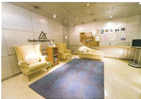
インプラント治療を受ける患者のための専用ロビー