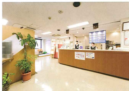
広く、明るい雰囲気の受付